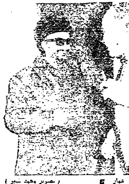
الرئيس سلام وأبو عمار

اما الجانب الآخر من هذا الموضوع فتناولت مناقشة هذا الموضوع في الاجتماع الذي حضره الرئيس كراي في موضوع طائفية الرؤساء الثلاثة لا يقرره سوى احصاء عام في البلاد